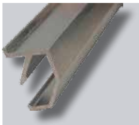
ND "Clic" Systeem-Frontprofiel