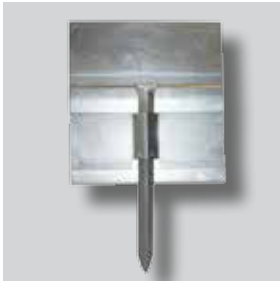
ND GARDLINER® StaalLight 210V