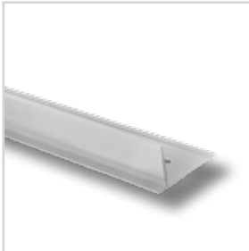
ND GARDLINER® PVC 45D

Een star, kunststof kantopsluitingsprofiel met een bouwhoogte van ca. 45 mm, als blijvende afgrenzing tussen beplante en vegetatievrije zones en verhardingen op groendaken. Het profiel heeft een perfecte lijnvorming.